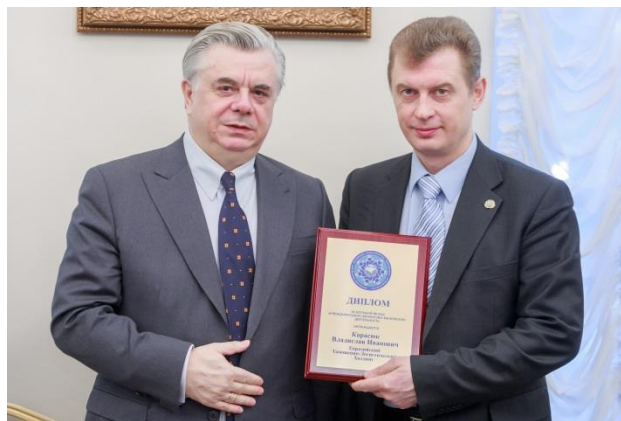
Карасюк Владислав Иванович – Генеральный директор Евразийского Таможенно-Логистического Холдинга (РФ)

Дипломы о вступлении в Ассоциацию и золотой значок члена ФБА ЕАС получили: